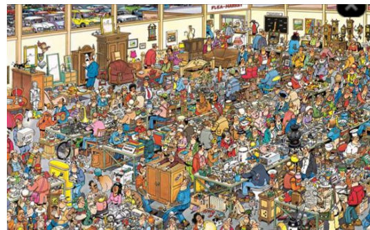
What to do during lockdown? Puzzelen!!!