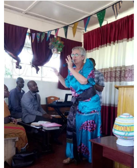
In Gomazi traditionele kleding

Ik heb in 2020 twee keer een nieuwsbrief geschreven en een keer of vijf een artikeltje in het magazine van mijn kerkelijke gemeente in Stiens. Ik wilde nu met een aantal foto's en korte teksten een beeld schetsen van 2020.