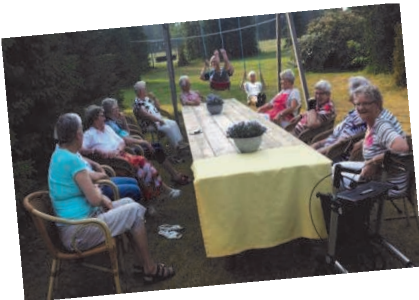
Ouderenvakantie in Den Ham